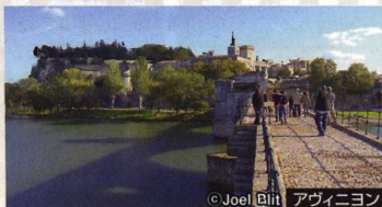
アヴィニオン