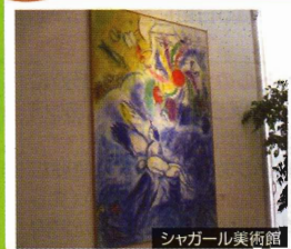
シャガール美術館