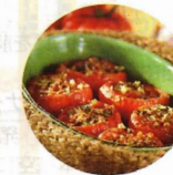
ファルシー 料理 (トマトを使った場合の調理例)