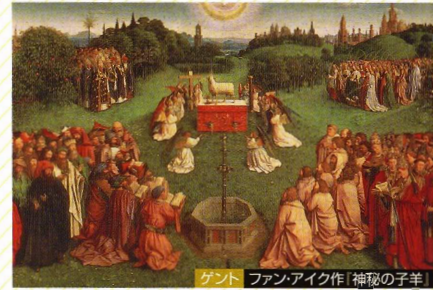
ゲント ファン・アイク作「秘蔵の子羊」